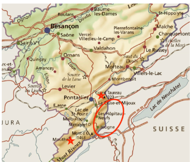
Fig.2 : Localisation de notre secteur « historique » d'étude (ovale) et nouvelles implantations de nichoirs (étoiles).

Depuis deux ans, nous avons tenté de développer le réseau de nichoirs dans le département du Doubs et en Suisse. Dans ce but, des sites potentiellement favorables avaient été visités au cours de l'automne 2019. Nos constatations sont les suivantes :